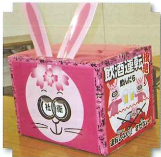
組合のマスコットキャラクター

組合では、岐阜市市街地の安全安心な街づくりと健全な発展を目指すため、暴力団の徹底排除を始め飲酒運転の根絶及び違法風俗営業の取締り等について、岐阜市長や関係警察署長に対して、本年2月にその徹底を要望したところです。またこれに併せて、街頭啓発活動を行うためにオリジナルキャラクターを考案しました。今後、これを活用して啓発を行い、健全な街づくりに努めていきます。