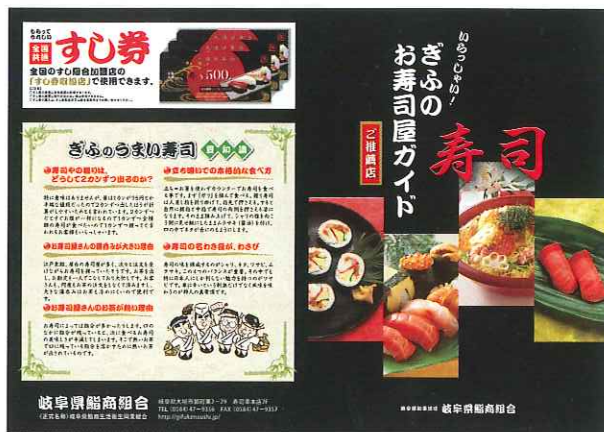
「ぎふのお寿司屋ガイド」のパンフ