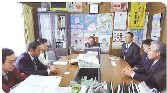
意見交換会（県クリーニング会館）

クリーニング組合からは、違反建築物等の改善に対する緩和措置（許容範囲の拡大）や、改善計画書の提出の経費及び改修費等に多額の費用がかかることから、事業者の経費負担を軽減する措置や、各事業者の現状を立入調査し、事業者の現状を十分理解してほしい、といった要望が出されました。