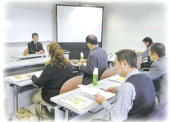
養成講習を真剣に受講されている方々

今年度も、新たに6名の方が委嘱されることとなり、既に昨年に養成講習会を受講され、4月1日付けて岐阜県知事から委嘱状が交付されました。今後の皆さんのご活躍を期待します。